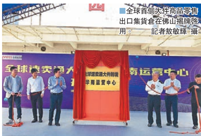
全球首個大件商品零售出口集貨倉在佛山揭牌啟用。

據介紹，大件跨境電商商品出口集貨倉設立後，廣東乃至整個華南片區的大件商品都可以通過跨境電商零售平台「一鍵」賣全球，拼櫃出海，物流成本更低，有利於廣東泛家居產業拓展海外電商市場。