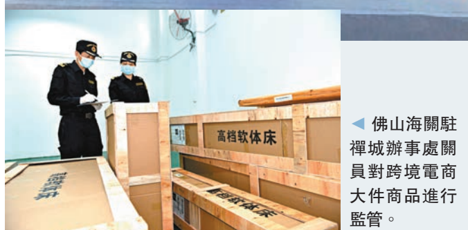
佛山海關駐禪城辦事處關員對跨境電商大件商品進行監管。