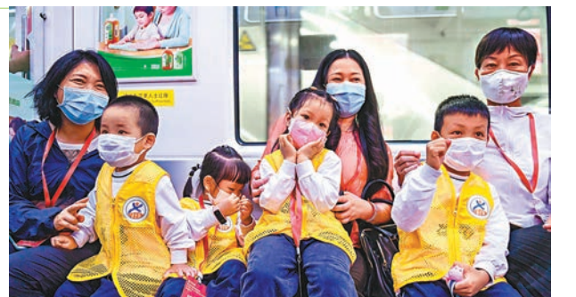
昨日，深圳地鐵8號線一期開通初期運營。