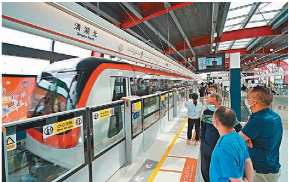
昨日，深圳地鐵2號線三期、8號線一期、4號線三期、3號線三期共四條地鐵新線同時開通，結束了鹽田、蓮塘、觀瀾、福田保稅區等片區無地鐵的歷史。圖為港鐵運營的四號線列車停靠在清湖北站。

香港文匯報訊（記者 郭若溪 深圳報道）昨日，深圳地鐵2號線三期、8號線一期、4號線三期、3號線三期共四條地鐵新線同時開通，全網線路增加到11條，運營總里程突破411公里。新線的開通結束了鹽田、蓮塘、觀瀾、福田保稅區等片區無地鐵的歷史，軌道線網可達性進一步提升。香港文匯報記者沿線乘車後發現，蓮塘口岸、沙頭角口岸、中英街和深港科創合作區（福田保稅區周邊）等多個港人聚居地也都能搭乘地鐵出行，不少在深港人讚出行更便捷。