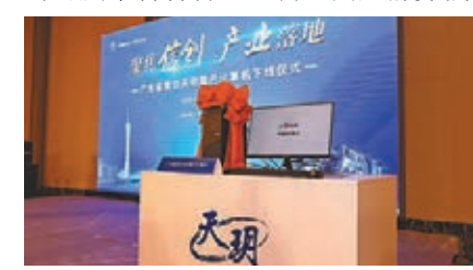
廣東省首台「天玥」國產計算機揭開面紗。

香港文匯報訊（記者 敖敏輝 廣州報道）昨日，由中國航天科工二院七〇六所（以下簡稱「七〇六所」）主辦的廣東省首台「天玥」國產計算機