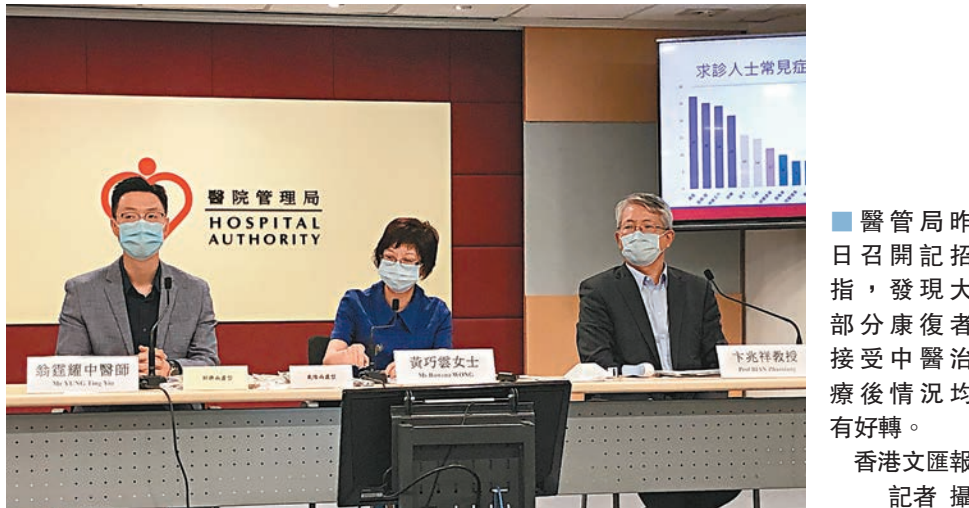
醫管局昨日召開記招指，發現大部分康復者接受中醫治療後情況均有好轉。