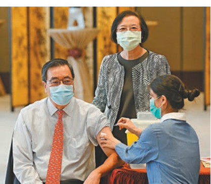
立法會主席梁君彥接種流感疫苗。

香港文匯報訊(記者 鄭治祖)行政長官林鄭月娥昨日率領多名司局長和副局長接種季節性流感疫苗，並呼籲市民及早接種流感疫苗，及保持良好的個人衛生和環境衛生，為應對冬季流感高峯期作準備。同日，食物及衛生局局長陳肇始、副局長徐德義及衛生署醫護人員亦到立法會為議員接種流感疫苗，期望藉以呼籲市民提高防疫意識。