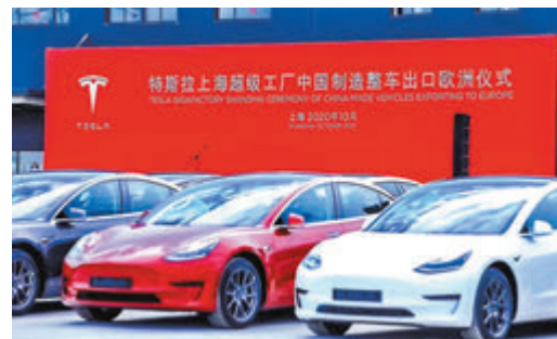
首批7,000輛中國製造特斯拉Model 3整車出口歐洲。

首9個月計，輸往部分主要目的地的整體出口貨值錄得跌幅，尤其是印度(跌19.4%)、德國(跌19.2%)、美國(跌19.2%)和新加坡(跌17.2%)。然而，輸往中國台灣(升8.2%)和中國內地(升4.0%)的整體出口貨值則錄得升幅。