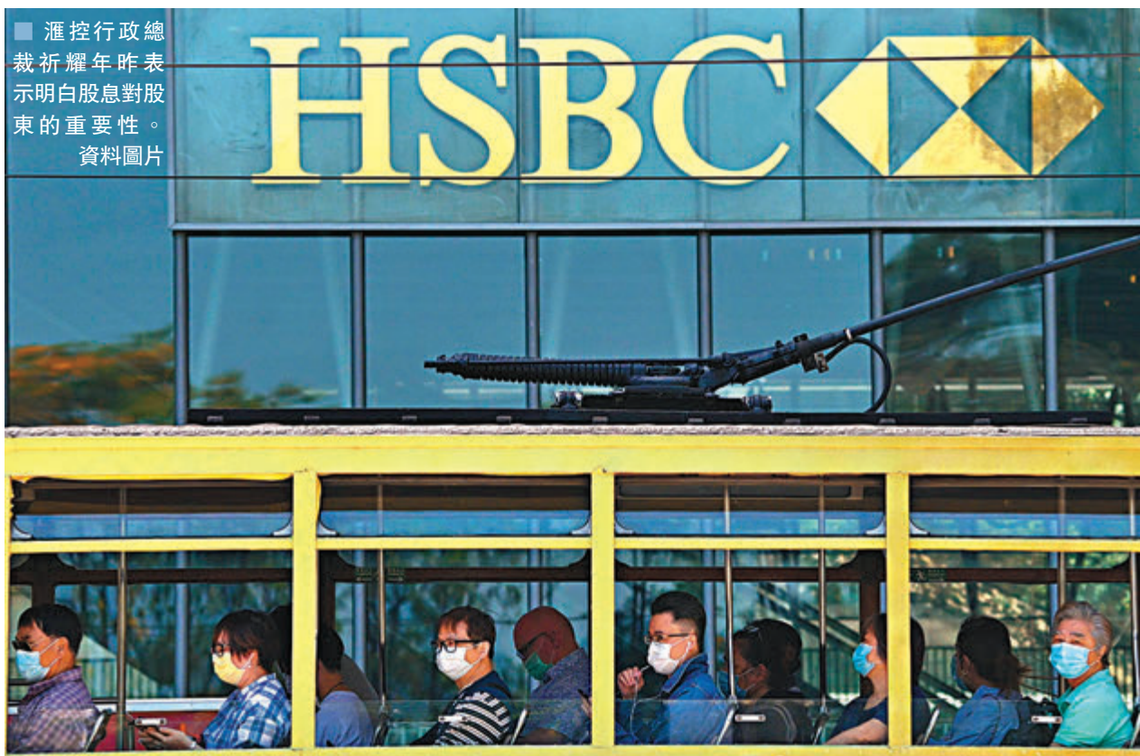
滙控行政總裁祈耀年昨表示明白股息對股東的重要性。

滙控公佈第3季業績，期內母公司普通股股東應佔利潤13.59億美元，按年跌54%，按季則急升近6.1倍。第3季列賬基準預期信貸損失及其他信貸減值準備降至7.85億美元，按年跌11%，按季減少近80%，主要是由於反映經濟前景自第2季以來趨於穩定，而批發業務的第三級準備則被與過往違約個案相關的撥回增加部分所抵消。截至9月底，普通股一級資本比率為15.6%，較6月底上升0.6個百分點。