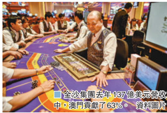
金沙集團去年137億美元營收中，澳門貢獻了63%。資料圖片

在金沙集團去年137億美元營收中，澳門貢獻了63%，新加坡則佔22%，不過當時賭場業務尚未受新冠疫情干擾。金沙目前正拓展在這兩地的業務，光是為澳門就提撥22億美元支出。