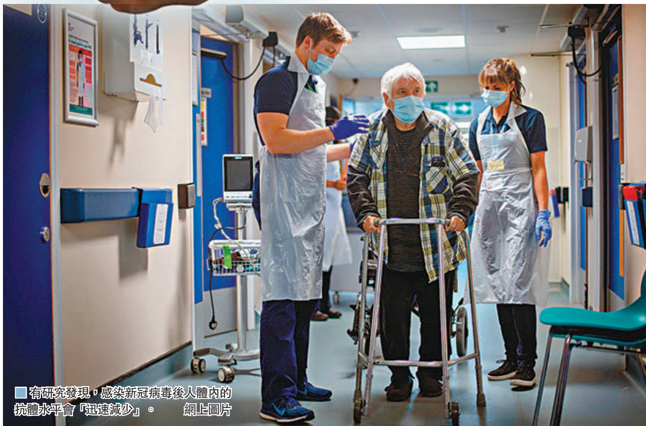
■有研究發現，感染新冠病毒後人體內的抗體水平會「迅速減少」。網上圖片