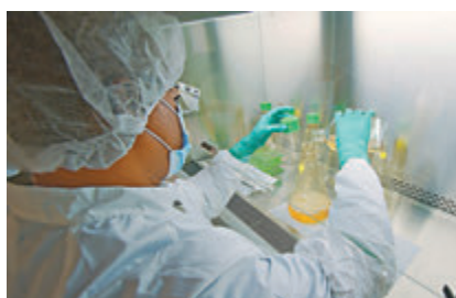
■禮來的測試被叫停。

美國國家過敏症和傳染病研究所(NIAID)前日叫停了禮來藥廠抗體藥物結合瑞德西韋的療法實驗，原因是這種療法在新冠重症患者身上效果不佳。抗體療法此前因為美國總統特朗普曾經使用而受到關注，不過禮來研發的抗體藥物兩周前已經因為潛在安全疑慮，暫停招募志願者。贊助研究的NIAID表示，根據進一步調查，禮來抗