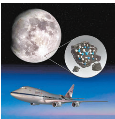
■SOFIA在月球南半球的克拉維斯火山口探測到水分子。網上圖片

美國太空總署(NASA)的研究團隊宣布，其「平流層紅外天文台」(SOFIA)首次在月球的日照面發現了水，顯示水可能分布在整個月球表面，而且不僅限於寒冷的陰影區域，意味未來人類若長駐月球，可以更容易地取得用於提供飲用水和火箭燃料的水源。