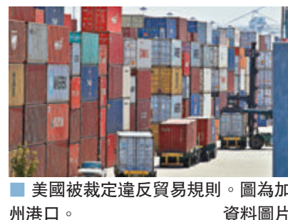
■美國被裁定違反貿易規則。圖為加州港口。