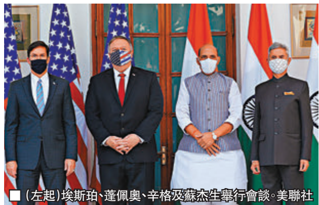
▲(左起)埃斯珀、蓬佩奧、辛格及蘇杰生舉行會談。

美國大選前一周，美國國務卿蓬佩奧與防長埃斯珀到訪印度，與印度外長蘇杰生及防長辛格舉行戰略與安全會談(「2+2會談」)，雙方簽訂一系列軍事合作協議，包括容許美軍向印軍分享敏感衛星及偵測器數據。埃斯珀在會後聲言，會談標誌美印聯手「對抗中國侵略」，中國外交部發言人汪文斌昨日則敦促美方停止炒作「中國威脅」，停止挑撥地區國家間關係、破壞地區和平穩定的錯誤