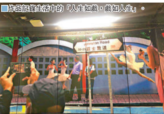
作品記錄生活中的「人生如戲，戲如人生」。