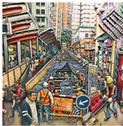
壁畫記錄了西營盤的建設過程。