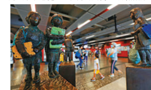
作品表面保留木材雕刻後形成的波紋。

同樣，對於創作者馮力仁來說，《人來人往》亦是改變自己人生軌跡的作品。彼時他還是一名全職的工程師，設計藝術作品是他業餘的愛好，當港鐵公司找上門，希望將他的作品放置於杏花邨站，他便開始思索很多問題：「由於杏花邨站只有一個出入口，在這裏放置一件藝術作品，影響力是很大的，」馮力仁說道，「當時我觀察就發現，其實上下班的時候是很壓抑的，我就決定這件作品必須讓人有回到家輕鬆的感覺。」他認為廣義上的藝術品往