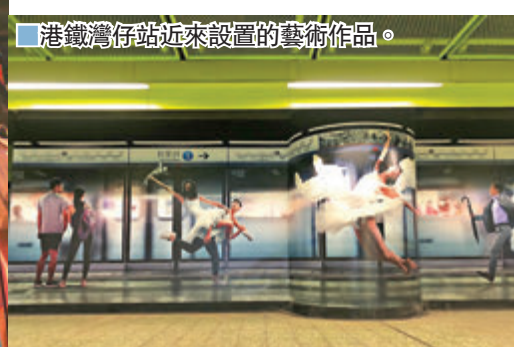
港鐵灣仔站近來設置的藝術作品。