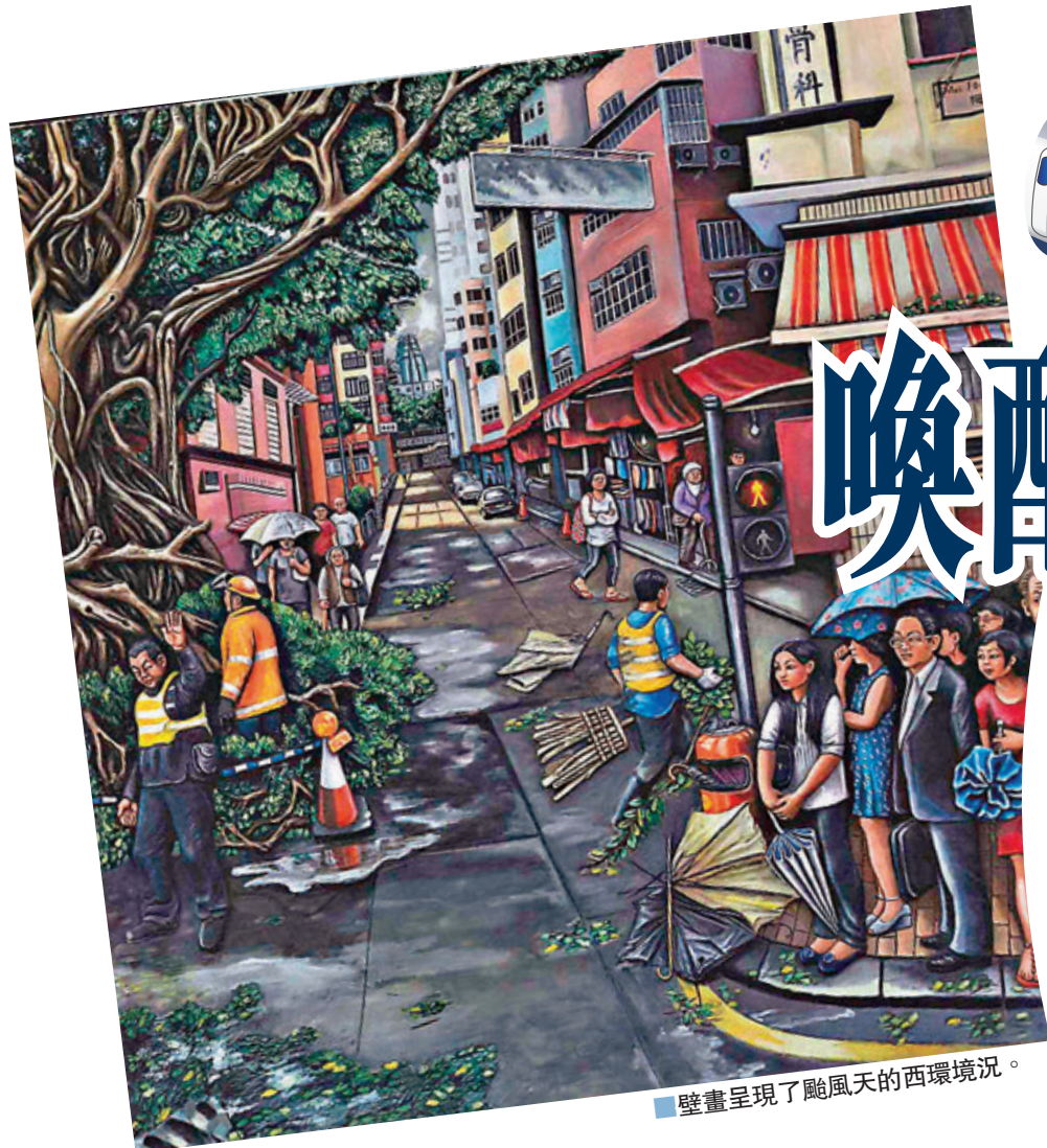
壁畫呈現了颶風天的西區境況。