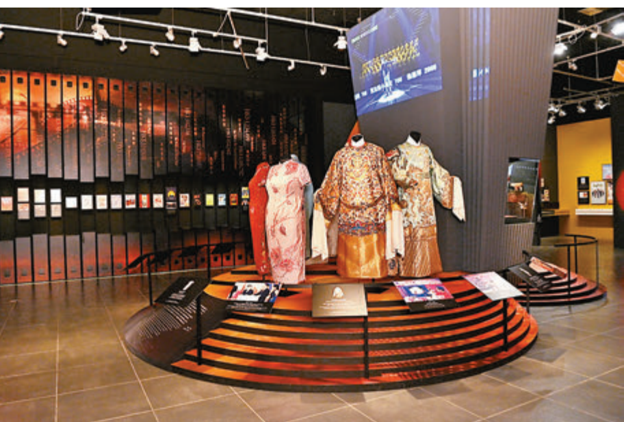
東華三院150周年展覽，回顧東華三院多年來於不同媒介的籌募活動。圖示電視籌款活動的部分服飾。

作為一介女流卻能如此大義，紛紛慷慨解囊支持醫院贈醫施藥，最終醫院開設十間新舖位，開始全面贈醫施藥。