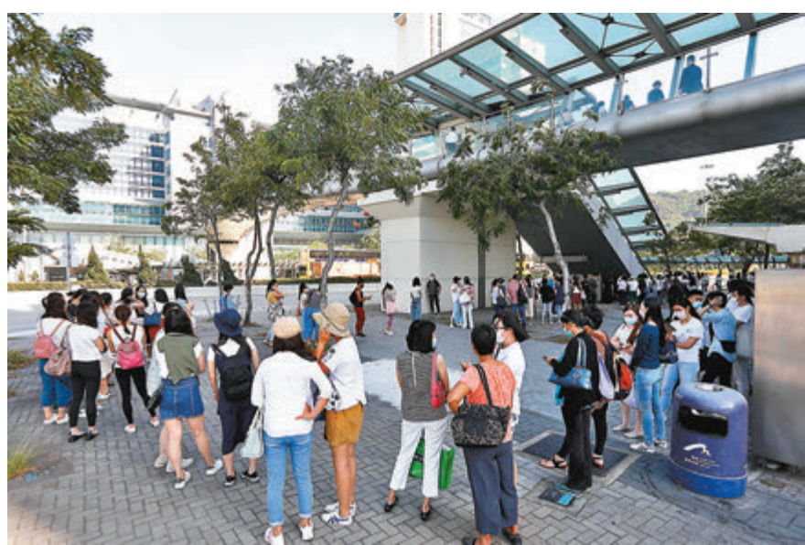
國泰工會昨日與公司管理層第二次會面，反映員工的憂慮，部分員工到國泰城了解情況。