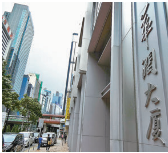
華潤集團宣布啓動為期3年的大型招聘計劃。圖右為灣仔華潤大廈。

香港經濟受到去年黑暴及今年疫情的夾擊，內外需求俱疲下，香港今年首兩季本地生產總值（GDP）分別按年下跌9.1%及9.0%；企業破產增加，今年首9個月，累計申請破產宗數6,656宗，按年增加12.05%。不少企業裁員減薪，最新的香港6月至8月失業率繼續高企於6.1%，仍徘徊於超過15年的高位。期內，就業不足率上升0.3個百分點，至3.8%，是自2003年「沙士」後的高位。