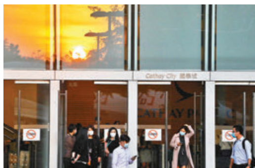
國泰員工下班情況。

香港文匯報訊（記者 成祖明）國泰航空上週三宣布大裁員，留任的員工若想獲發額外津貼，便需於今天簽署新僱傭合約，並不得遲於下週三回覆，否則會被視作解僱。有員工指出，新合約的條款不清晰，並要減薪最多四成，認為管理層只減薪一年，但員工減薪卻是無期限，有「肥上瘦下」之嫌。國泰工會昨午與管理層進行第二次會面，反映員工的憂慮，要求延後簽約期限和改善合約條款，惟工會會後引述指管理層堅持一定會推行新合約，工會對此表示失望，今日會與勞工處會面商討，以及約見律師索取法律意見。