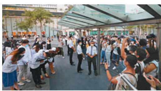
工會代表向到場支持的國泰員工致謝。