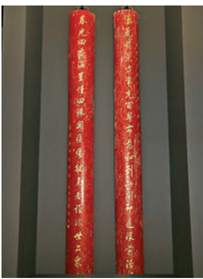
香港南北行早年送贈東華醫院的對聯。