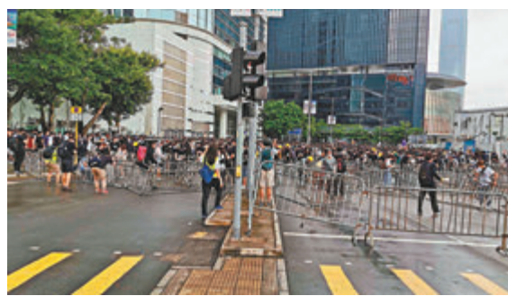
■當日有暴徒將鐵馬推出馬路及用索帶繫起製作路障。