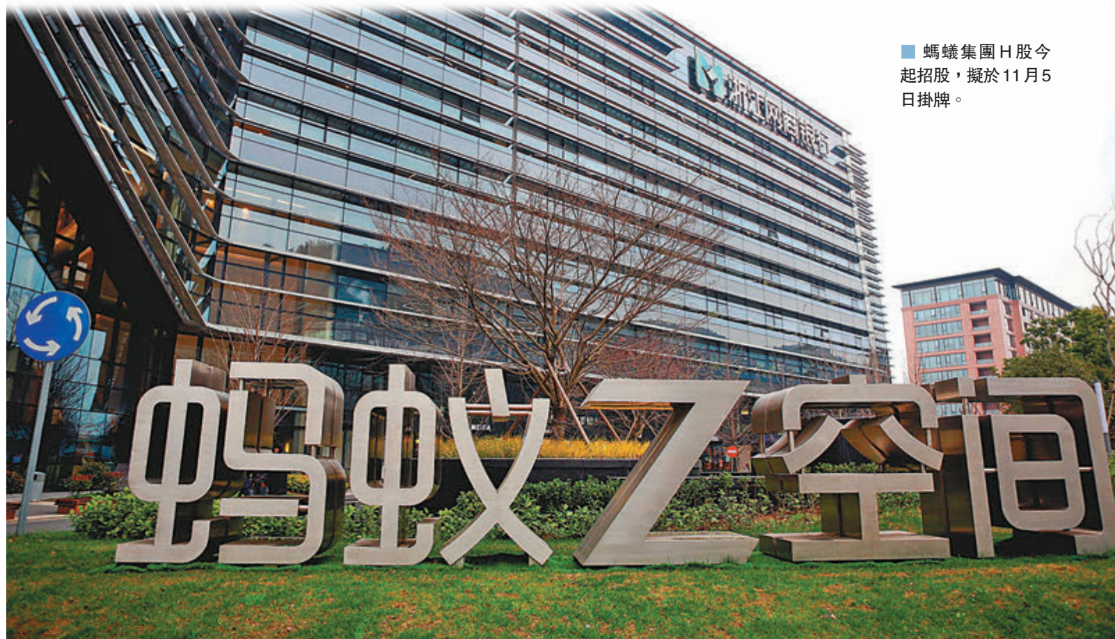
螞蟻集團H股今起招股，擬於11月5日掛牌。

滙豐早前亦預告，將為個人客戶預留超過1,000億元資金作螞蟻集團新股認購貸款，雖然暫仍未公布最終孖展利率，但該行形容為極廉宜孖展利率。另外，恒生早前亦指將為個人客戶預留充裕資金作螞蟻孖展認購。