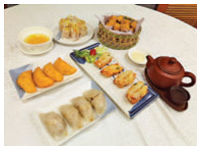
鳳城招牌點心金光炸粉果、蝦多士等。

重開後的鳳城酒家換上更現代化及整潔的裝修，保留傳統鳳城出品，配上新潮的擺設，留住老顧客之餘，也希望可以做到年輕人市場。重開後一個多月，食客反應理想。雖然還未達到收支平衡，我們目標是希望品牌老店可以繼續不斷