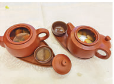
蟲草嫩雞及燉螺頭湯用茶壺上，可保溫。