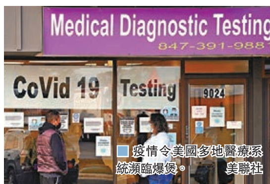
疫情令美國多地醫療系統瀕臨爆滿。