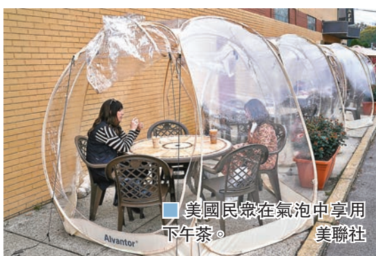
美國民眾在氣泡中享用下午茶。