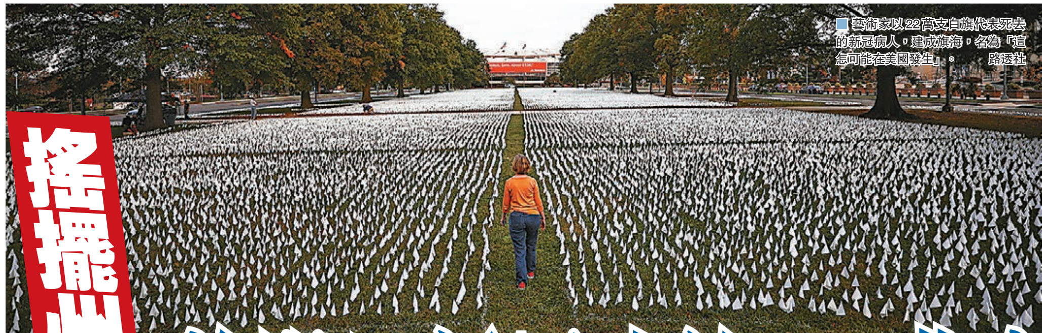
藝術家以22萬支白旗代表死亡的新冠病人，建成旗海，名為「這怎可能在美国發生」。

美國新冠肺炎疫情持續惡化，前日確診病例增加超過8.4萬宗，創下自疫情爆發以來單日新高。華盛頓大學研究人員預測，除非幾乎所有美國人都佩戴口罩，否則到了明年2月，美國累計病斃人數可能高達50萬。