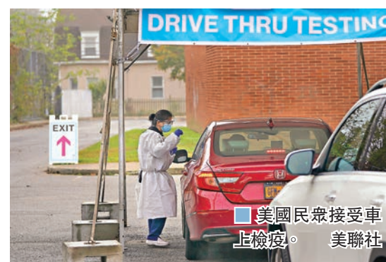
美國民眾接受車上檢疫。

世界衛生組織總幹事譚德塞前日形容，北半球確診及病斃人數上升，情況「令人擔憂」。美國前日新增確診84,218宗，打破7月16日單日增加77,362宗的紀錄。16個州份前日確診人數同創單日新高，包括被視為總統大選勝負關鍵的俄亥俄、密歇根、北卡羅來納、賓夕法尼亞及威斯康星5州。