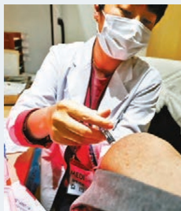
韓國醫生為民眾注射流感針。

韓國衛生部昨日表示，韓國昨日再有12人在接種流感疫苗後死亡，累計死亡人數增至48人，約80%死者是介乎70歲至80多歲的長者。不過當局強調，目前完成的20名死者驗屍結果，均顯示死因與疫苗沒有直接關係，因此當局將繼續進行免費接種計劃。預防接種專門委員會昨日召開會議，進一步討論分析結果，並研究今後的接種計劃。