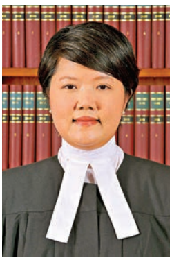
■裁判官劉淑嫻 資料圖片

香港文匯報訊(記者 葛婷)黑暴分子去年10月1日在各區堵路及打砸燒。當日，逾百防暴警在荃灣清障及驅散暴徒時，被人由行人天橋拉圾桶蓋，涉案青年承認襲警罪，經審訊後前日在西九龍裁判法院被裁定罪名成立，還押等候判刑。辯方早前聲稱作供警員陳述的字眼和細節與書面供詞不符，質疑證人的可信性。裁判官劉淑嫻表示，所有作供警員誠實可靠、實話實說，並直言警員並非以書寫維生，書面證供未能如數家珍般道出細節，並不影響警員證人的可信性。