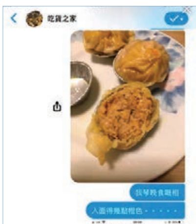
■「黃店」「吃貨之家」被投訴蟹粉小籠包無蟹粉。「連登」圖片

「銅鑼灣肥屍」就話：「『光時』嘅鬧劇好×丟架，真係天下烏鴉一樣黑。」「牙東團」慨嘆：「個個掛架(住)食人血饅頭。」「連登煩膠」就話：「班管理層自己肥就得，比(界)多少『手足』就唔得，裝返幾部冷氣比(界)『手足』用下(吓)都好啦。」「紅豆」就講出實情：「錢，係可以令到90%既(嘅)人同野(嘢)變質。」