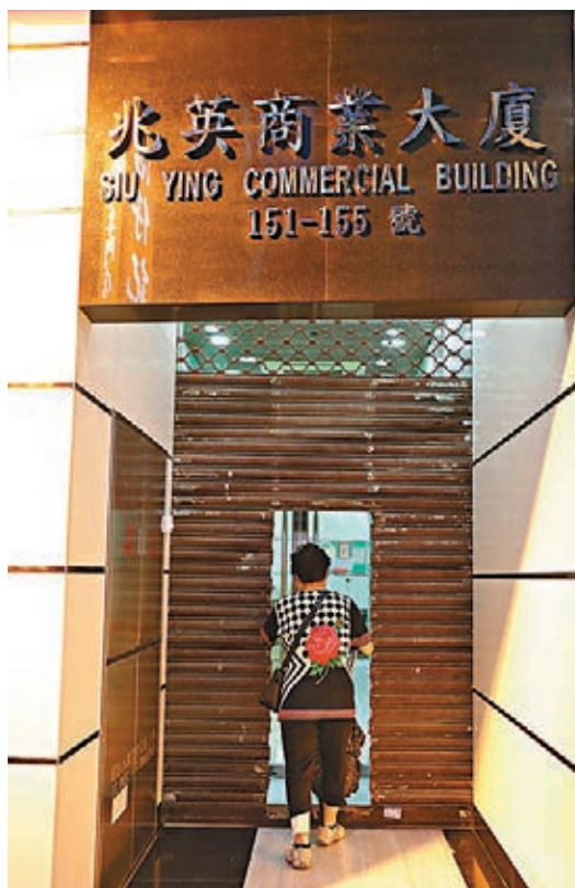
■初步確診的男女職人員，在上環皇后大道中的兆英商業大廈工作。