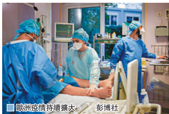
■歐洲疫情持續擴大。

歐洲新冠疫情持續反彈，前日新增確診個案首次錄得逾20萬宗，而歐洲在短短10天前，才首次錄得單日確診突破10萬宗，反映疫情擴散速度極快。據美國約翰霍普金斯大學的統計，西班牙目前累計逾102萬宗確診病例，但首相桑切斯昨日稱，當地實際感染人數可能高達300萬人，原因是疫情初期檢測出的個案數字太低。