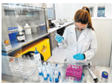
■研究顯示牛津研發的新冠疫苗測試結果「完美」。