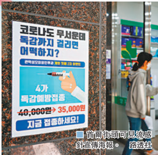
■首爾街頭可見流感針宣傳海報。

韓國接種流感疫苗後死亡的案例持續攀升，截至昨日錄得最少36宗同類個案，不過政府解剖首名接種後死亡的死者後，證實死因與疫苗無關。部分地方政府包括慶尚北道浦項市，已決定暫停讓民眾打針，不過衛生部門堅持不會叫停接種計劃，更指地方政府不應擅自作出決定，政府昨日繼續召開會議商討。