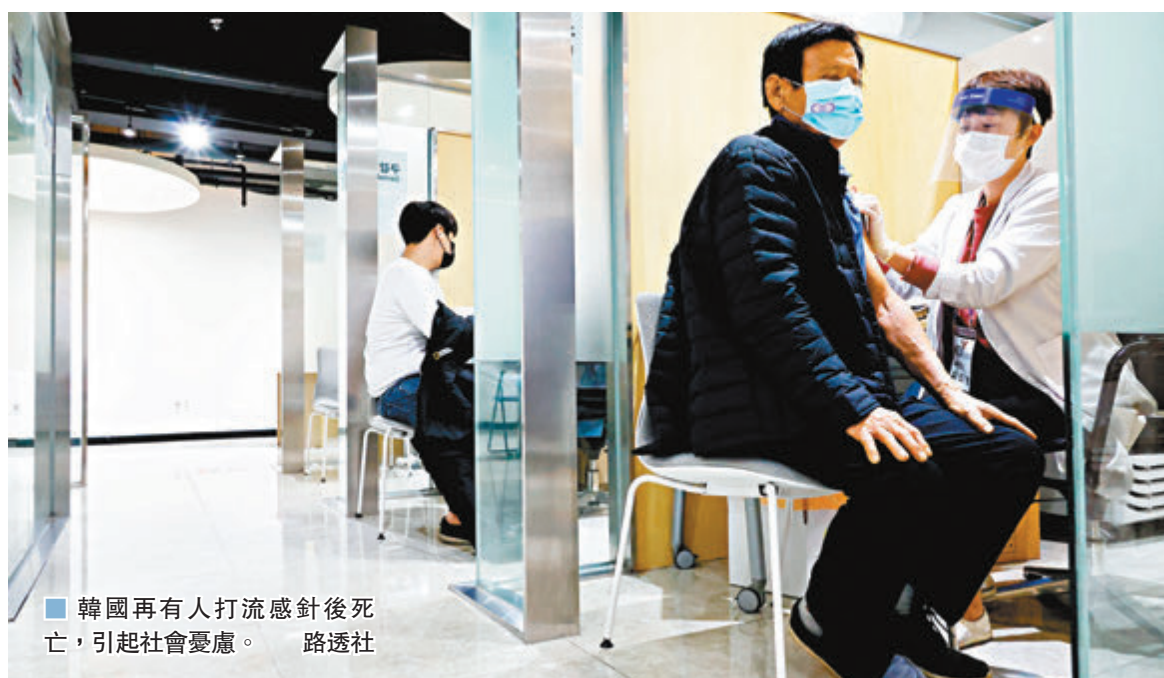
■韓國再有人打流感針後死亡，引起社會憂慮。

韓國每年約有3,000人因流感死亡，今年為免社會受新冠疫情及流感同時衝擊，政府目標是讓國內3,000萬人接種流感疫苗，佔韓國總人口逾半，至今有830萬人打針，350人出現不良反應。 不過接種流感疫苗後死亡的案例亦愈來愈多，截至當地時間昨日下午1時，已有最少36人打針後死亡，較前一日再新增8宗。死者絕大部分為長者，其中22人是接種政府提供的免費疫苗，不過按照政府統計，未有特定藥廠或批次的疫苗出現大量死亡個案。