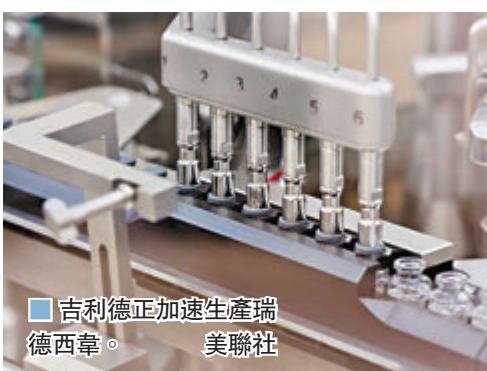
■吉利德正加速生產瑞德西韋。