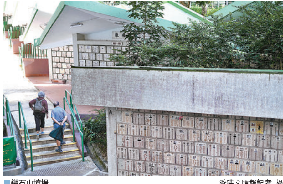
▲鑽石山墳場