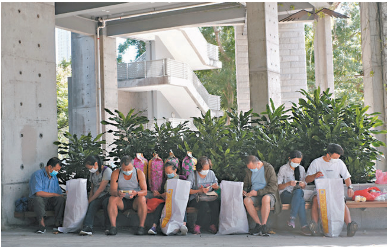
▲孝子賢孫擲元寶祭祀先人。 香港文匯報記者 攝

▲陳小姐坦言對私營骨灰龕場安排難以接受，故未有為亡父上位，並將骨灰暫存長生店。 ▲陳小姐與龕場經多次書信往來，終達成協議。