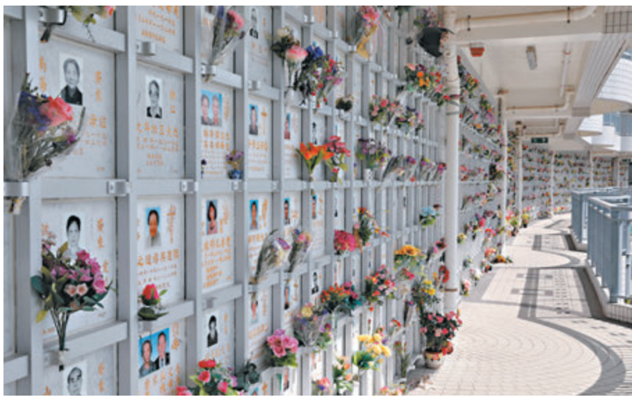
▲薄扶林墳場