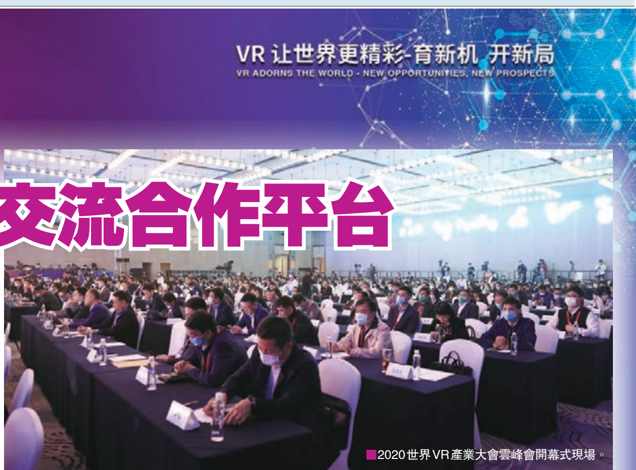
■2020世界VR產業大會雲峰會開幕式現場。