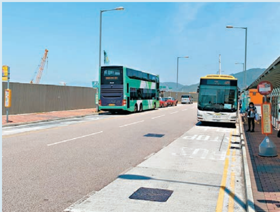
■ 業界認為，東涌新填海區的鐵路建設預計要到2029年才建成，而周邊的資助房屋用地亦未交付，增加投資風險，導致發展商出價低。圖為該地皮周邊近貌。資料圖片

東涌第57區商業地上周截標，收到3份標書，來自新地、長實，以及由信置與嘉里合組之財團，當時市場已因反應差，預料地皮會流標。昨日地政總署亦不意外地宣布，因地價未達底價，所以3份標書均不獲接納。翻查資料，今次已為年內第二次出現商業地流標，對上一幅為今年5月，估值逾100億元的啟德第2A區4號、5(B)號及10號商業地流標。