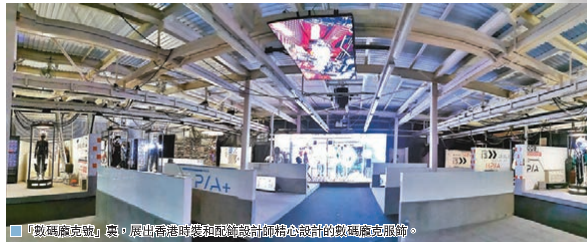
「數碼龐克號」裏，展出香港時裝和配飾設計師精心設計的數碼龐克服飾。