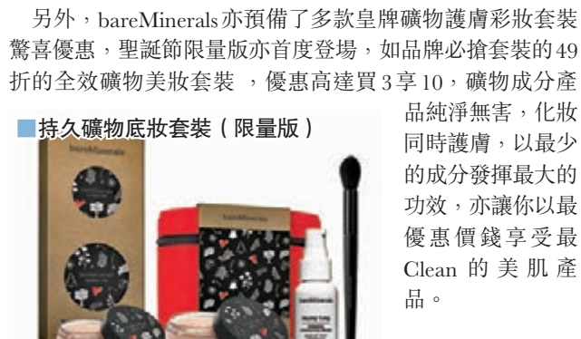
持久礦物底妝套裝 (限量版)

另外，bareMinerals 亦預備了多款皇牌礦物護膚彩妝套裝驚喜優惠，聖誕節限量版亦首度登場，如品牌必搶套裝的49折的全效礦物美妝套裝，優惠高達買3享10，礦物成分產