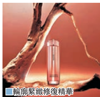
輪廓緊緻修復精華