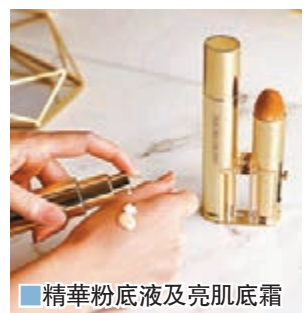
精華粉底液及亮肌底霜

韓國護膚品牌 AMOREPACIFIC 一直宏揚韓方美顏智慧，其殿堂級抗衰老系列 TIME RESPONSE 自推出以來，一直穩守暢銷榜首位，今年品牌再推出 LINE-AGING CORRECTOR 輪廓緊緻修復精華，採用萃取自30年樹齡的茶樹根部強效皂苷成分，精準抗皺淡紋，重點改善深淺紋理，重塑年輕肌膚輪廓，激發年輕潛能。