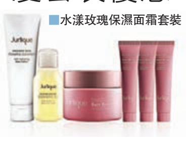
水漾玫瑰保濕面霜套裝

半年一度的 SOGO Thankful Week 崇光百貨感謝周年慶今天正式開鑼至11月29日，屆時會分成3個階段舉行，不少化妝護膚品牌都已經為大家準備了一系列精選優惠套裝。例如，Jurique 大部分優惠套裝更低至5折，同時亦有多項驚喜購物禮遇。當中於10月24日特設水漾玫瑰保濕面霜套裝優惠，售價：$360 (價值：$720)，包羅了水漾玫瑰保濕面霜50ml、盈透卸妝油30ml、亮肌潔面粉沫20g、水漾玫瑰保濕啫喱10ml x 2及水漾玫瑰保濕乳液10ml。