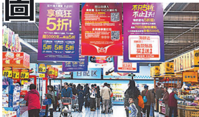
阿里巴巴與高鑫零售將進一步推動新零售戰略。資料圖片

翻查資料不難發現，高鑫是內地最早進行數位化改造的商超之一。2018年初大潤發率先進行數位化改造，2019年初大潤發全國門店均可提供「1小時達」，現高鑫旗下所有門店均已接入與阿里巴巴的淘鮮達及天貓超市，為客戶提供「1小時達」及「半日達」及時配送消費體驗。截至6月底，高鑫零售於中國共有481家大賣場及3家中型超市，未來還將加強小型化和社區化線下店舖布局。