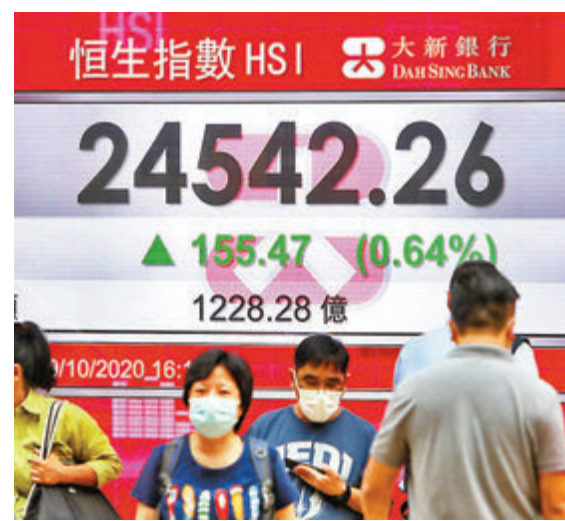
港股昨日成交1,228億元。中通社

該公司並表示，隨着5G無線通訊逐漸廣泛地應用，恒生滬深港新世代通訊指數追蹤新世代通訊價值鏈參與企業之表現，包括無線電訊服務、通訊設備及電訊顧問的服務供應商。