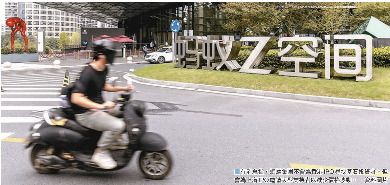
有消息指，螞蟻集團不會為香港IPO尋找基石投資者，但會為上海IPO邀請大型支持者以減少價格波動。

昨日人民幣兌美元中間價報6.701，較上日大升322點子或0.48%；在岸市場人民幣兌美元收盤價6.6935，較上日升47點子或0.07%，兩者同創18個月新高。至昨晚10時，人民幣兌美元離岸價報6.6814。