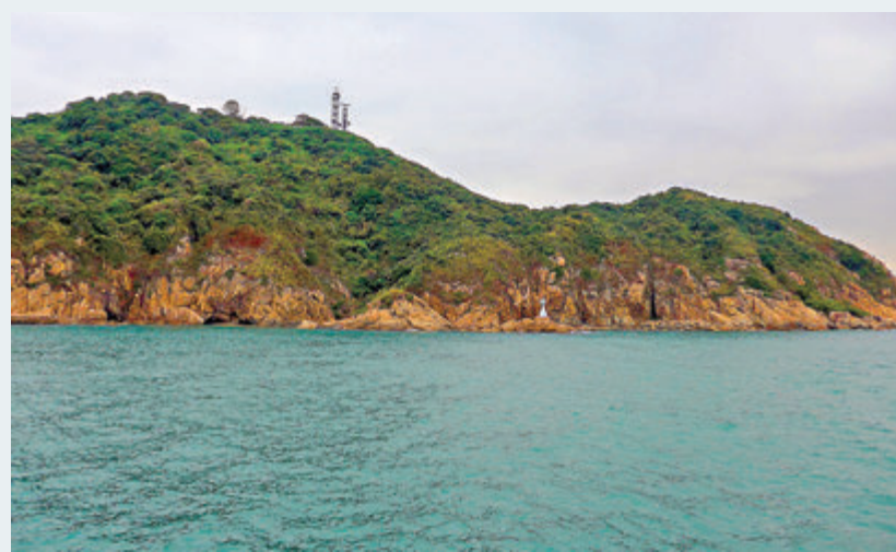
▲交椅洲 資料圖片 ▲特區政府考慮為「明日大嶼計劃」發債融資。圖為「明日大嶼計劃」電腦效果圖。 資料圖片

行政長官林鄭月娥日前接受多份媒體訪問時表示，香港不少工程產生建築廢料，她認為這不是垃圾而是填海的填料，可以廢物利用幫香港造地，「這些填料在港無出路，十多年前，開始運到內地台山，這是中央同意的，香港的填料在台山已填出幾百公頃土地。」最近香港再運送填料到台山時，中央政府認為需要平衡生態保育與發展，最後中央政府雖然允許香港繼續運送填料到台山，但仍有填盡之時。 她重申，現屆政府重視中長遠土地房屋政策，不過，於現今的政治氣氛下，保育突然