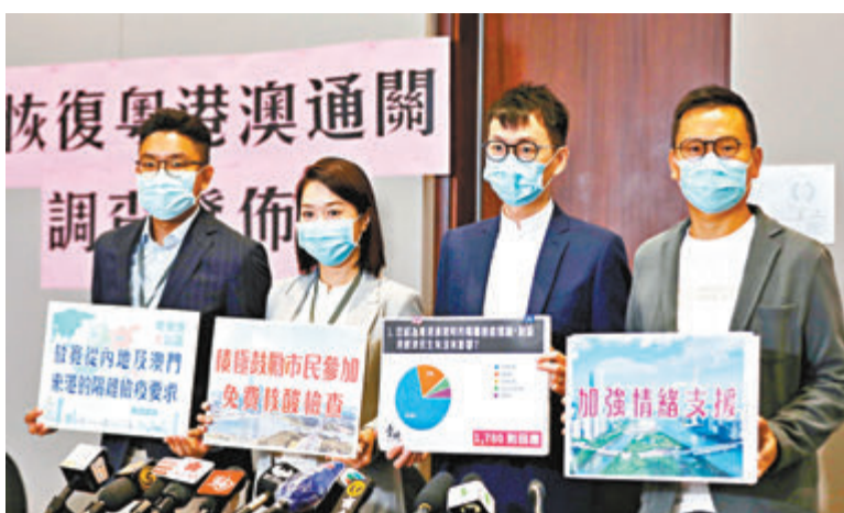
「青研香港」的一項調查發現，九成受訪者希望粵港澳恢復正常通關。香港文匯報記者 攝

另外，「青研香港」就粵港澳恢復通關以問卷形式於本月中訪問超過1,700人，結果顯示七成受訪者認為控關對個人情緒造成影響；超過六成受訪者認為措施對個人事業發展造成大影響；近七成受訪者認為，措施對個人生活造成影響；超過七成受訪者支持本港單方面減少或取消對內地和澳門的入境限制。