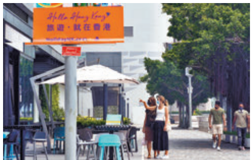
旅遊發展局公布，9月初步訪港旅客只有9,132人次，按年跌99.7%。圖為尖沙咀文化中心海濱餐廳，只有零星遊客光顧。

旅遊發展局主席彭耀佳表示，該局除了正加強於新加坡的宣傳外，亦希望通過一系列「360 Hong Kong Mo-