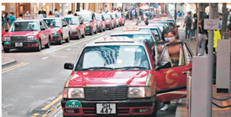
28個的士團體聯署去信運輸署，要求開徵每程6元的保險附加費。資料圖片

香港文匯報訊（記者 文森）近年有關的士包攬訴訟詐騙保險賠償的案件增多，令的士車保的保費及墊底費也上升，28個的士團體聯署去信運輸署，要求開徵每程6元的保險附加費，抵消保費上升的成本壓力。