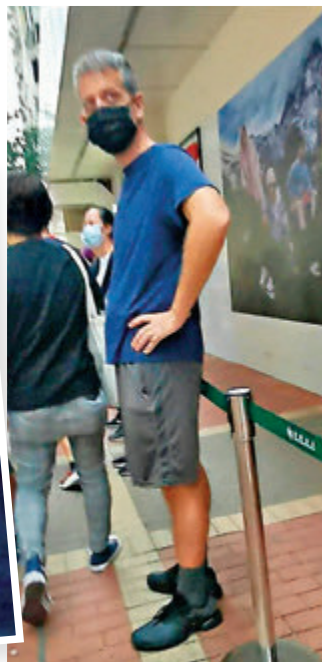
一名戴黑口罩的外籍男在街站外圍觀察約一小時。