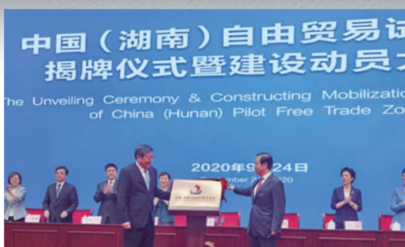
■湖南省委書記杜家毫(左)，湖南省委副書記、省長許達哲為湖南自貿區揭牌。

規模工業的增長貢獻率達50.9%，佔據了半壁江山。其中，計算機、通信和其他電子設備製造業增長19.9%，汽車製造業增長17%。中高端裝備產品中，新能源汽車成倍增長，電子計算機整體增長51.4%，建築工程機械增長27.1%。