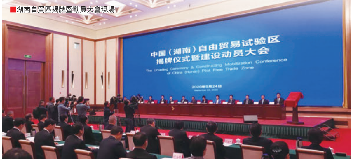
■湖南自貿區揭牌暨動員大會現場

岳陽城陵磯新港區先後投資200多億元，建設了37個泊位(含在建6個)，年吞吐量達2835萬噸，逐步形成岳陽城陵磯綜合保稅區、啟運港退稅政策試點港、汽車整車進口口岸、進口糧食指定口岸、固廢進口指定口岸，以及中部地區唯一的進口肉類指定口岸「一區一港四口岸」格局。