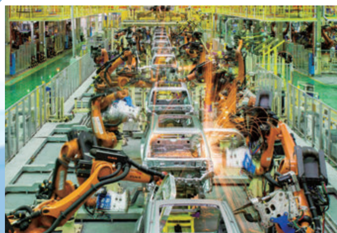
■智能製造在湖南飛速發展，工業機器人在生產線上廣泛應用。

湖南自貿區的申報成功，是對湖南多年苦練「內功」、不斷夯實基礎的一種肯定，是水到渠成後的瓜熟蒂落。