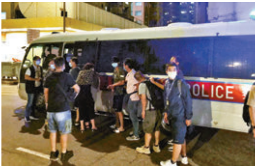
■警方連搗3間無牌酒吧，涉案者被帶署扣查。