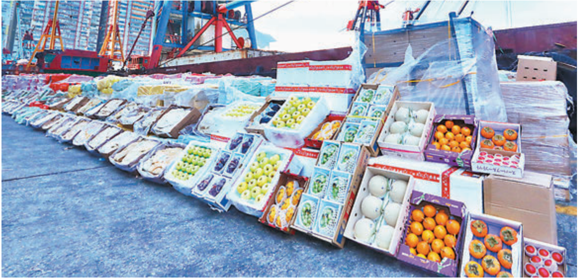
■海關人員在反走私行動中截獲共重4噸的走私水果。

疫情持續，陸路出入境受限下，私梟繼續選擇水路進行「集運」式走私。海關上周四（15日）在西部水域龍鼓洲附近截查7艘可疑船隻包括躉船，檢獲多達240噸走私凍肉和約重4噸的貴價水果，總值約2,000萬元，涉稅約1,550萬元，同時拘捕22名涉案男子。今次是海關首次發現利用躉船走私貴價水果，以及使用特製尼龍袋裝載貨物以減少搬運時間。資料顯示本年經水路走私的凍肉案件、總重量、價值及被捕人數均遠超過過去10年總和，相信與私梟為逃避關稅鉅而走險外，亦與內地對凍肉進口的管制有關。