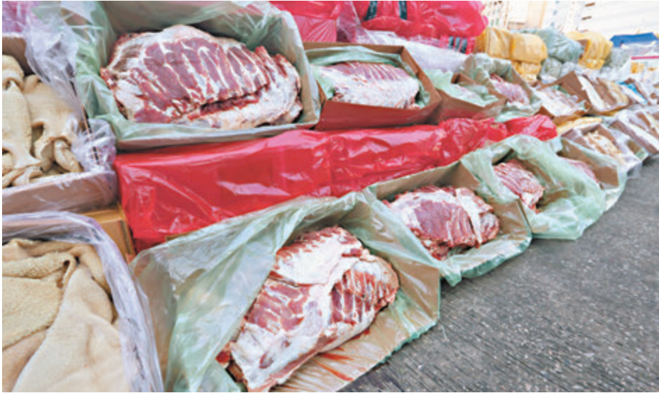
■海關在反走私行動中截獲240噸凍肉。