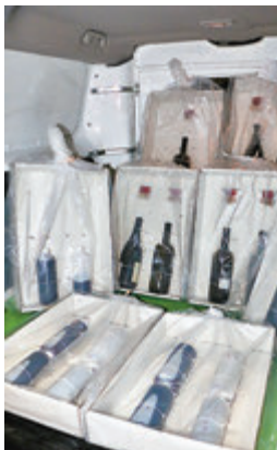
■海關機場截獲的酒樽裝液態可卡因。

海關強調，會繼續根據風險管理原則，重點揀選高風險地區的旅客作清關檢查，以確保打擊跨境販毒活動。根據《危險藥物條例》，販運危險藥物屬嚴重罪行，一經定罪最高可被判罰款500萬元及終身監禁。