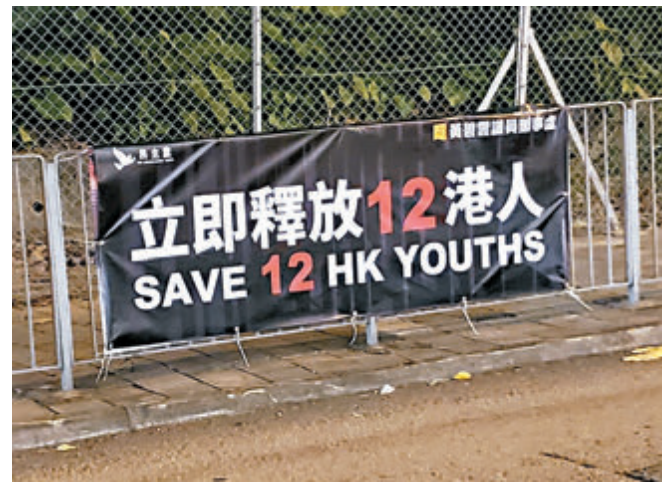
攬炒派議員涉濫用橫額位置宣傳政治歪理。香港文匯報記者攝

「十二逃犯」早前潛逃離港時進入內地司法管轄區，因偷渡而被內地執法部門拘捕。「香港監察」就事件發聲明稱，「十二逃犯」一事，若國際社會不作出強烈抗議，等同允許中央在內地起訴和監禁「香港社運人士」，也將以此為先例，透過香港國安法把其他「社運人士」送回內地受審，及判以長期的監禁。「香港監察」要求西方國家的議員及政府，利用外交影響力，促使該12人能返港受審，及保障他們被囚時的人權云云。 羅傑斯及在香港的「對華政策跨國議會聯盟」顧問邵嵐，日前發起所謂「一人一相」網上行動，鼓動國際社會關注「十二逃犯」，英國保守黨人權委員會委員倫倫、逃亡海外的