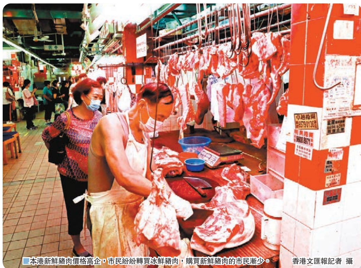
本港新鮮豬肉價格高企，市民紛紛轉買冰鮮豬肉，購買新鮮豬肉的市民漸少。