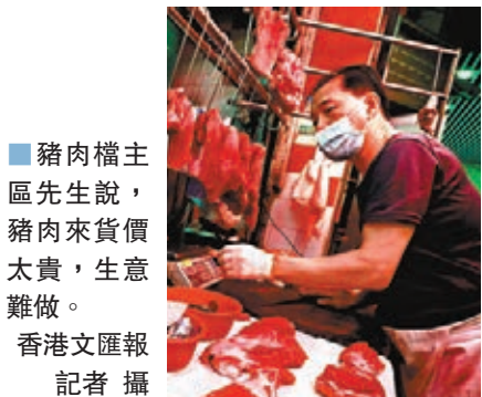
豬肉檔主區先生說，豬肉來貨價太貴，生意難做。