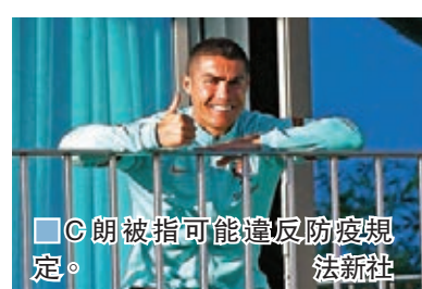
C朗被指可能違反防疫規定。法新社

香港文匯報訊(記者楊浩然)意大利體育部長斯柏達福拉昨日表示，確診新冠肺炎的C朗由葡萄牙飛返都靈家中隔離，可能違反了防疫規定。