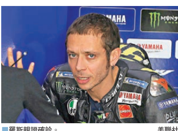
羅斯親證確診。

世界電單車錦標賽(MotoGP)傳奇車手羅斯昨日親證感染新冠肺炎。現年41歲的9屆世界冠軍羅斯表示，自己在周四早上起床後感覺不適，渾身痠痛和有輕微發燒，經檢測後結果呈陽性反應。這位Yamaha車隊車手勢必缺陣本周末和下周末，同樣在西班牙阿拉岡賽道上演的比賽。今屆比賽尚餘5站賽事，羅斯目前於車手榜以58分排第13位。 ■綜合外電