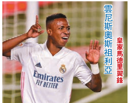
雲尼斯奧斯祖利亞

馬達依然狀態大勇，勢必為巴塞防線帶來重大威脅。(now611及632台周日3：00a.m.直播)