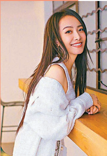
宋茜票數劇減，由第一名跌落第三名。