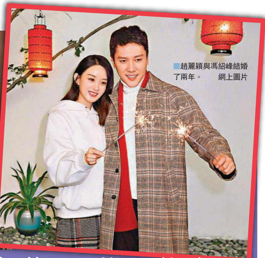
趙麗穎與馮紹峰結婚了兩年。