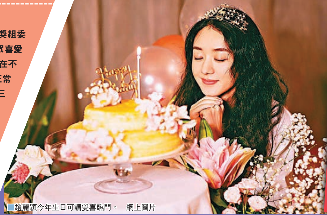
趙麗穎今年生日可謂雙喜臨門。

香港文匯報訊（記者 依江）金鷹獎組委會前晚突然發布一份聲明，指「觀眾喜愛的男、女演員獎」的網絡投票中存在不正當投票行為，組委會聲明針對非正常投票「零容忍」，並對於金鷹獎第三輪網絡投票異常票數進行了剔除。一夜之間，「觀眾喜愛的女演員」原本網絡得票最高的宋茜被清除將近60萬票淪為第三名，趙麗穎從第三位躍居第一，遠超譚松韻。昨日亦是趙麗穎的33歲生日，可謂雙喜臨門。