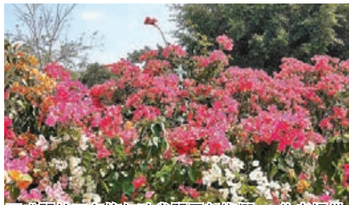
盛開的三角梅如孔雀開屏般燦爛。

不識君」的緣故吧。可貴的是，它們年復一年，無怨無悔，無聲無息，盡其所能，燦爛開放。