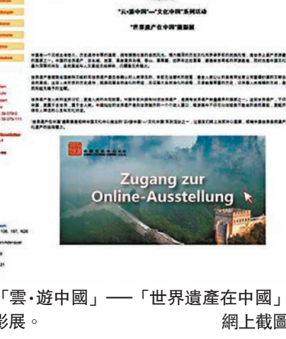
「雲·遊中國」——「世界遺產在中國」攝影展。網上截圖

柏林中國文化中心早前推出「雲·遊中國」——「美麗中國」旅遊短片和人文風光紀錄片展映，先後上線《中國超乎你的想像》、《山地公園省多彩貴州風》兩部短片以及大型紀錄片《四季中國》。為幫助德國公眾和在德華人更好地了解中國防疫真實情況，柏林中國文化中心選取了《中國防疫志》、《武漢志工》、《戰疫之家》、《守望相助共同抗疫》、《為生命而戰》等五部防疫主題短片，以及中國中央歌劇院的兩部防疫主題音樂作品《陽光燦爛》和