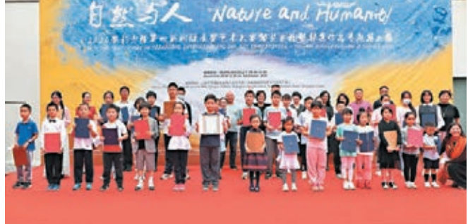
頒獎典禮上，部分獲獎小藝術家們合影。