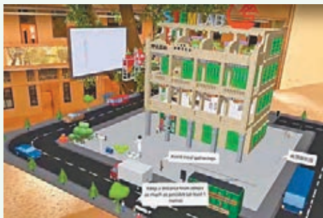
作品「VRAR 抗疫導賞員」介紹灣仔風景。作品短片截圖