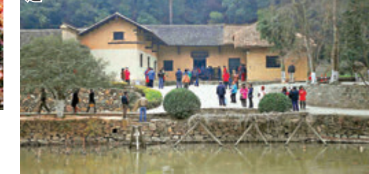
遊客在韶山毛澤東故居拍照留念。