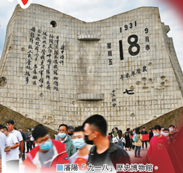
潘陽「九一八」歷史博物館。