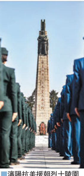
瀋陽抗美援朝烈士陵園