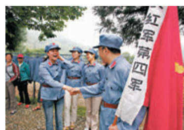
一些到井岡山旅遊的遊客穿着紅軍服裝拍照留念。