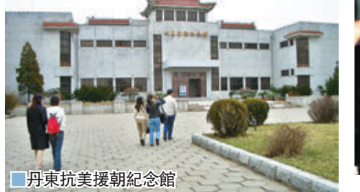
丹東抗美援朝紀念館