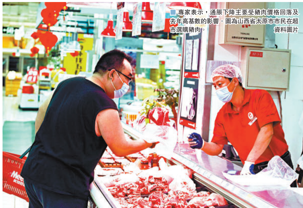
專家表示，通脹下降主要受豬肉價格回落及去年高基數的影響。圖為山西省太原市市民在超市選購豬肉。

香港文匯報訊（記者 海巖 北京報導）國家統計局昨日發布數據顯示，9月內地豬肉價格同比漲幅大幅收窄，環比轉降，拖累當月消費者價格指數（CPI）同比漲幅下降0.7個百分點至1.7%，時隔18個月再次回到「1時代」。專家表示，通脹下降主要受豬肉價格回落及去年高基數的影響，消費及服務價格繼續回升；國際原油價格疲弱，拖累工業品價格降幅超預期擴大，並不影響工業生產繼續復甦，預計國內經濟增長繼續拾級而上，四季度經濟表現可能好於預期。