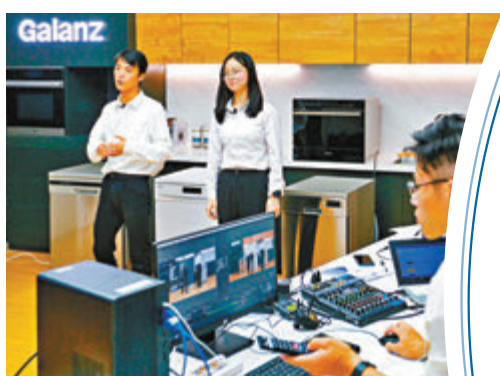
參展商之一的格蘭仕正直播介紹新品。

同時，梁惠強說：「我們在此次廣交會的直播環節設置了面向亞太、歐洲、北美、拉美的區域專場，針對戰略合作夥伴