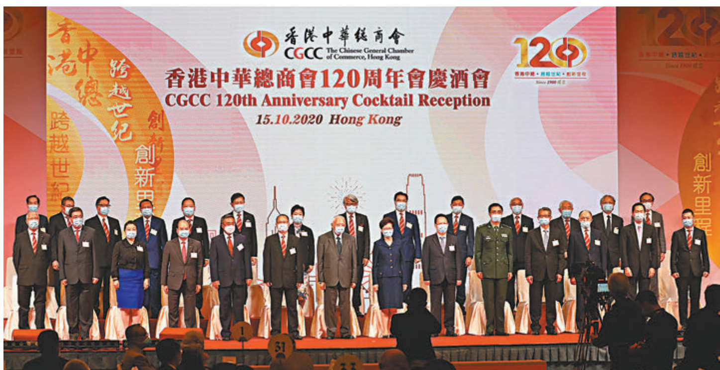
香港中華總商會舉行120周年會慶酒會，全國政協副主席董建華、特區行政長官林鄭月娥、中聯辦副主任譚鐵牛等擔任主禮嘉賓。