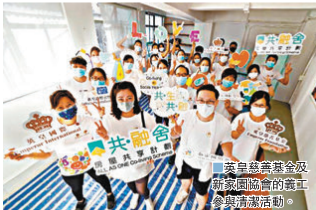
英皇慈善基金及新家園協會的義工參與清潔活動。