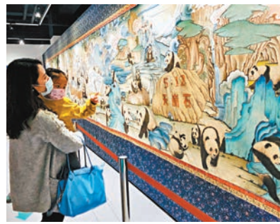
長卷共繪製有600餘隻大熊貓。