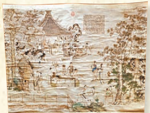
丁觀鵬《西園雅集圖》