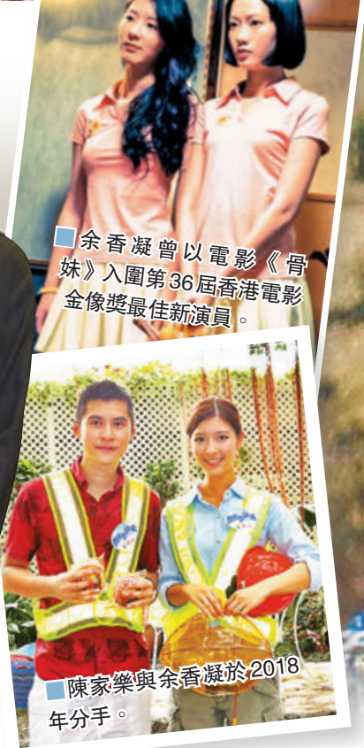
余香凝曾以電影《骨妹》入圍第36屆香港電影金像獎最佳新演員。