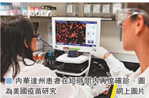
內華達州患者在短時間內再度確診。圖為美國疫苗研究。

荷蘭研究人員在醫學期刊《臨床傳染病》發表報告，指出荷蘭一名89歲老婦在再度感染新冠病毒後死亡，是全球二