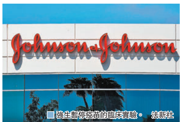
強生暫停疫苗的臨床實驗。

美國大型醫療用品生產商強生的新冠肺炎單劑疫苗正進行第3階段臨床實驗，強生前日公布，由於有一名實驗志願者出現「無法解釋的病症」，故暫停疫苗實驗，是繼英國藥廠阿斯利康後，全球另一款新冠疫苗的臨床實驗中途暫停，更是首次涉及美國大型企業，對極力希望盡快推出疫苗的總統特朗普而言是一大挫折。知情人士指出，像強生今次的大規模實驗，中途暫停情況並不罕見，亦有專家提及在阿斯利康事件後，醫藥界都更小心看待疫苗實驗。