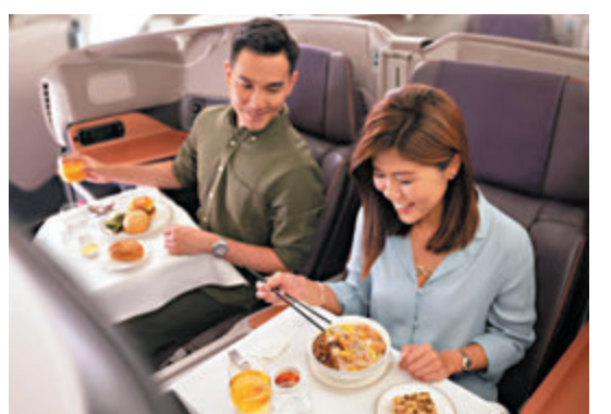
顧客可在不飛的飛機上食飛機餐。

新冠疫情令旅遊業冰封，航空業紛紛推出所謂「偽出國」的服務自救，亦讓無法外遊的顧客一解旅遊癮。新加坡航空則將空中巴士A380客機變身餐廳，讓顧客在不飛的飛機上一嚐飛機餐，座位在前日開放預約後30分鐘即額滿。新加坡航空選擇兩架停泊樟宜機場的A380客機，分別推出經濟艙、商務艙至頭等艙等不同價位的飛機餐，價格介乎53.5至642坡元(約305至3,668港元)，顧客除享用飛機餐外，亦可使用機上的娛樂系統；由於需保持社交距離，公司只開放客機一半座位。[A380餐廳]原定只在本月24日及25日開放，不過由於反應熱烈，公司決定加開10月31日及11月1日，另外亦推出「頭等艙外賣」，將全套頭等艙膳食、餐具、拖鞋及梳洗用具送上門，售價888坡元(約5,074港元)。 ■綜合報道