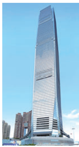
■環球貿易廣場獲BREEAM In-Use最高評級

由新地旗下啟勝管理服務有限公司管理的環球貿易廣場，多年來運用科技來達致環保管理，致力成為優秀的綠色智能建築。透過各種能源優化措施，環球貿易廣場由2012年至今已節省共1500萬度電，相當於超過4500戶三人家庭的全年用電量，有助減少10000噸的碳排放。團隊多年來以「智能、協作及持續性」為管理方針，運用智能科技，實踐智能管理系統，監察及控制不同設施與設備的運作及用電量，又應用物聯網科技，使用流動數碼系統收集大數據，經分析後從而優化樓宇的能源效益。團隊積極連繫社區，與租戶及持份者攜手進行環保及節能工作，實踐可持續發展。