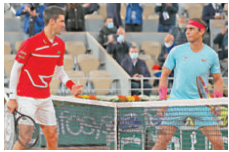
在泥地場面對拿度，祖高域(左)處於下風。