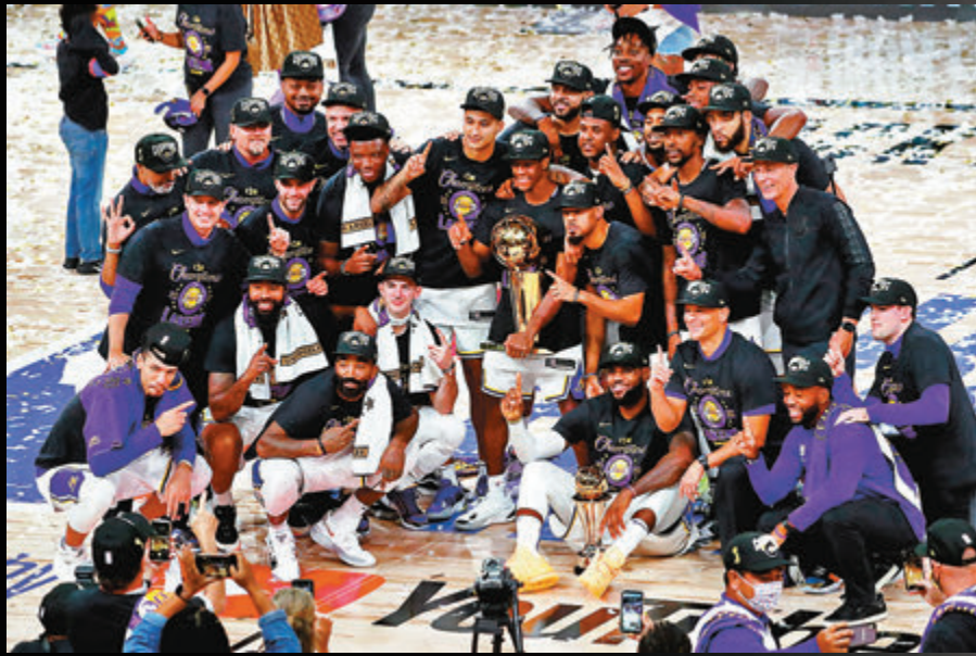
時隔10年，湖人重奪NBA總冠軍寶座。