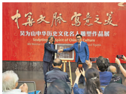
國家大劇院院長王寧與展覽作者、中國美術館館長吳為山共同為展覽揭幕。