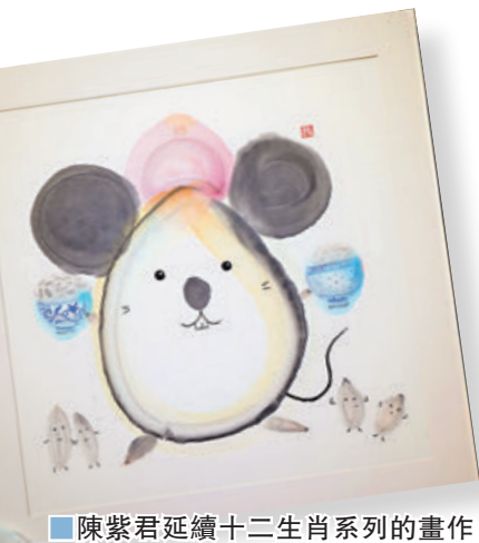
陳紫君延續十二生肖系列的畫作之老鼠作品。