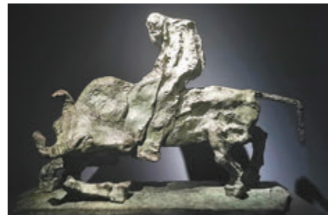
吳為山雕塑作品《紫氣東來——老子出關》