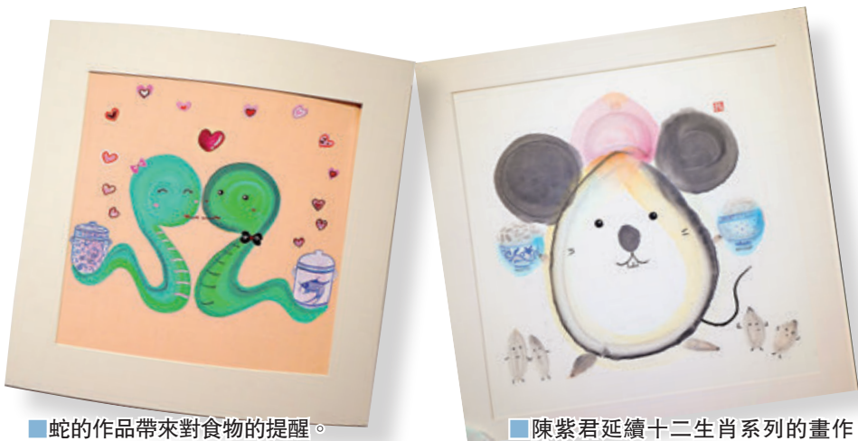
蛇的作品帶來對食物的提醒。