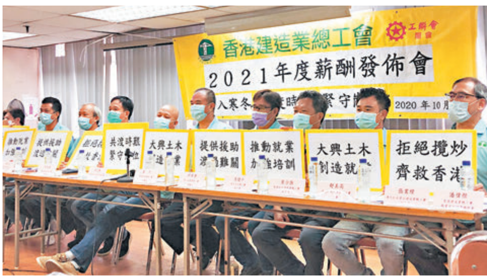
香港建造業總工會建議從事15個工種的工友，由今年11月「凍薪」至明年11月。

同時，政府應加快舊區重建速度和力度，全面推行公共屋邨改善工程，並推出短期合約工程，例如公眾衛生間和各區行人路翻新