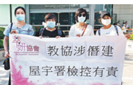
萃妍協會舉報教協僱建。

應有知情權，從而規避風險。」而教協過去曾被傳媒踢爆有多處地方涉嫌僱建，團體「萃妍協會」昨日就有關情況到西九龍政府合署屋宇署總部舉報，促署方進行調查。「萃妍協會」代表表示，據傳媒過去報道，教協的多個會址涉嫌僱建，但教協負責人僅以「過去未有收過相關部門反映」作回應。她以學生在犯校規