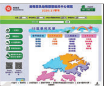
教育局昨發布「幼稚園及幼稚園暨幼兒中心概覽」。網站截圖

而在報名費方面，參加幼稚園計劃的學校上限為40元，另半日班與全日班註冊費上限分別是970元與1,570元；其他私立學校如獲教育局批准，則可收取較高費用。概覽顯示，多所國際學校的幼稚園相關收費較昂貴，如香港學堂國際學校報名費達2,800元，為上限的70倍；加拿大國際