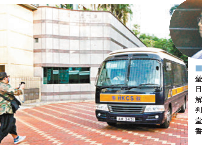
後，換衣服和手袋再離開。

事後警方翻查現場的閉路電視片段，發現鍾和蘇在事發前數分鐘一併同於翠屏花園C座一單位落樓，而她在逃脫及返回單位約20分鐘