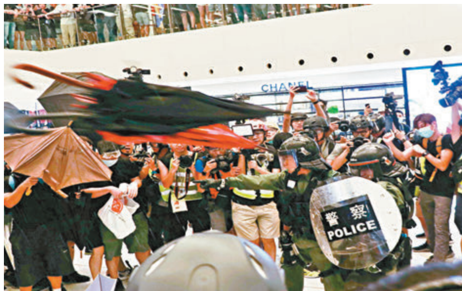
▲當日進入新城市廣場執法的防暴警員遭大批暴徒投擲雨傘等硬物襲擊。