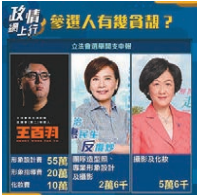
■NOW新聞台上載三參選人「置妝」開支。

一個好好搵錢的項目，出數有名。」 「Yiuming Li」亦話：「有錢吾（唔）搵咩！但吾（唔）好嘅（咁）難睇呀，好似急性發錢寒，唉！肉酸！」[Poon Teddy] 直言：「諗住政府錢好嘅，洗定個八月十五（坐監）。」