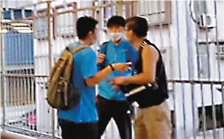
▲「Lunch仔」日前搞「和你買樓」近尾聲時，喺朗屏西鐵站附近被三名穿黑衣嘅男女尾隨。佢聲稱期間被人言語騷擾襲擊，用雨傘扑頭、「篤肚」。