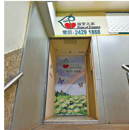
3宗本地個案當中，帝苑酒店群組再有一人確診，患者為酒店意大利餐廳染疫男侍應的家人，而殘疾院舍「國寶之家」群組及China Secret酒吧群組亦分別再有一人染疫。