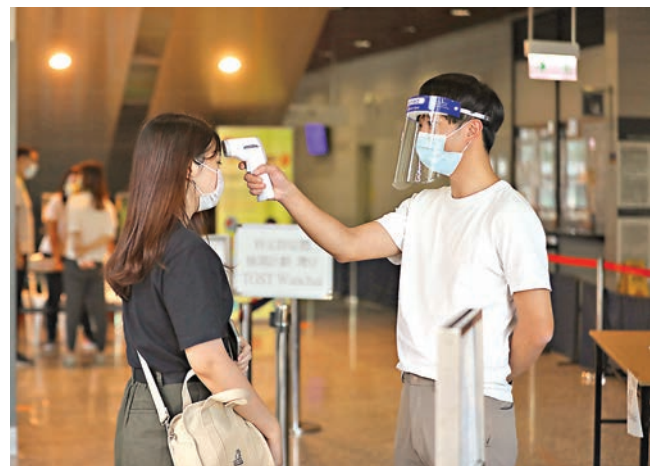
政府於灣仔設立臨時檢測中心，免費為市民進行病毒檢測。

香港文匯報訊（記者 文森）政府因應新冠病毒疫情近日明顯反彈，加強為市民檢測，包括昨日起率先在灣仔設立臨時檢測中心，免費為市民進行病毒檢測，有曾到帝苑酒店用膳的市民昨日特別到場檢測，亦有外僱主特別帶同外僱前往檢測；民政事務總署則夥同樂善堂合作一連兩日在泰籍人士聚居的九龍城區，派發樣本瓶進行免費檢測。昨到灣仔臨時檢測中心視察的食物及衛生局局長陳肇始則再呼籲市民嚴守防疫措施，有不適則盡快求醫並接受檢測。