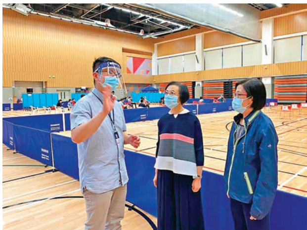
陳肇始及陳漢儀昨到灣仔的臨時檢測中心了解中心運作。