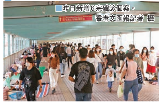
昨日新增6宗確診個案。