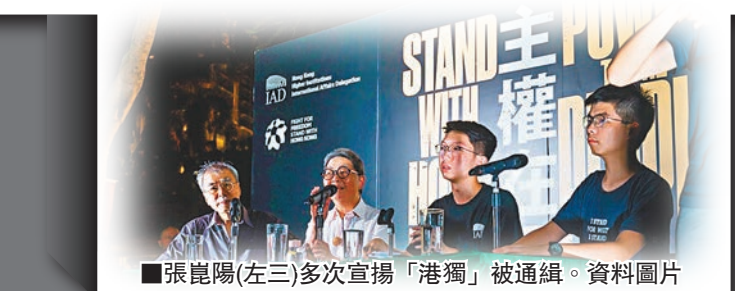
■張崑陽(左三)多次宣揚「港獨」被通緝。資料圖片