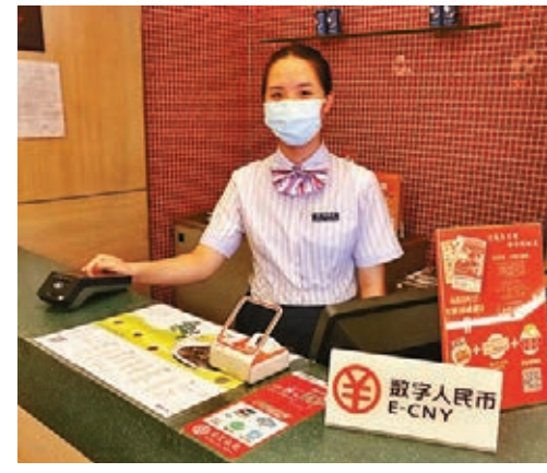
圖為麵點王展示的數字人民幣貨幣POS機。

香港文匯報訊(記者李昌鴻 深圳報道)記者昨日走訪了位於羅湖區委附近的麵點王，該連鎖店也參與此次羅湖區千萬元數字貨幣紅包活動，成為3,300多個商家中的一員。