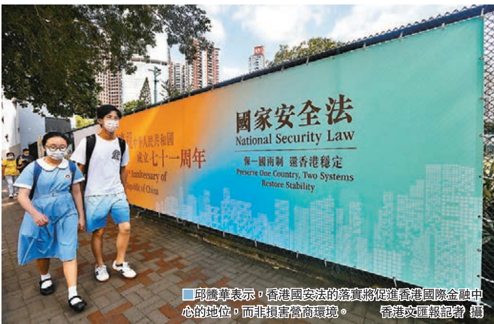
■邱騰華表示，香港國安法的落實將促進香港國際金融中心的地位，而非損害營商環境。

若有違反誓言的言行，聶德權指，當局會審視是否構成了不擁護基本法，不效忠香港特別行政區。如果構成，牽涉到是否堅守「一國」原則，是否接受「一國兩制」，是否宣揚「港獨」，或者分裂國家等，政府對此完全不能容許。若觸犯法律則按法律處理，若是違規言行，則按紀律懲處的機制，判斷是否違反了公務員守則等，再按程序處理，情況最嚴重的是革職。