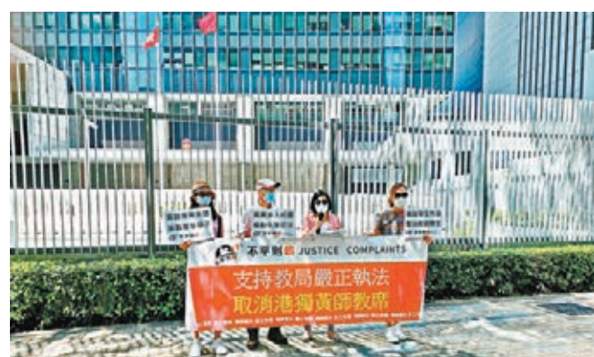
■市民團體到政總門外支持教育局的「釘牌」決定。

教育局發言人則強調，家長及社會大眾對教師專業操守有很高期望，對失德或違法個案，局方會嚴肅處理，並在查明屬實後作適當懲處，不枉不縱。針對是次取消註冊個案，局方經過詳細及嚴謹的調查程序，並兩次邀請涉事者提交書面解釋，包括讓他在知悉有可能被取消註冊、了解事態嚴重的情況再次作申述，過程中他亦有法律顧問協助。如涉事教師不同意局方決定，可根據《教育條例》提出上訴，強調局方是依法辦事處理教師註冊事宜。