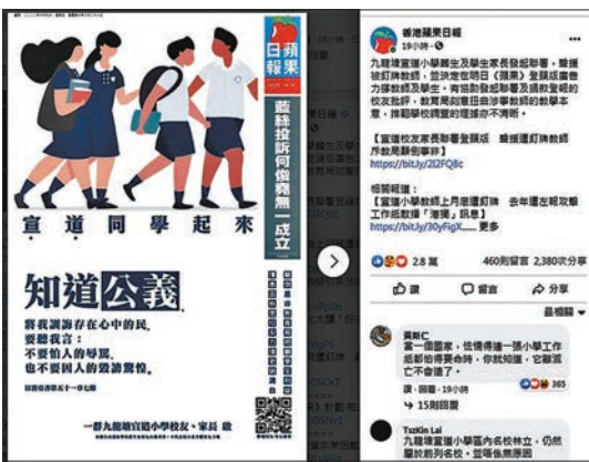
▲有人騎劫九龍塘宣小校友及家長名義，在《蘋果日報》登廣告煽動學生參與違法活動。