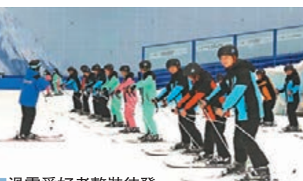
滑雪愛好者整裝待發

34個溫泉SPA項目。據悉，成都融創文旅城項目佔地約4800畝，總投資約550億。由融創樂園、融創雪世界、融創水世界、融創茂、高端酒店群、錦秀劇場、國際會議中心、濱湖酒吧街等業態組成，是集多元產業於一體的世界級綜合旅遊度假目的地。