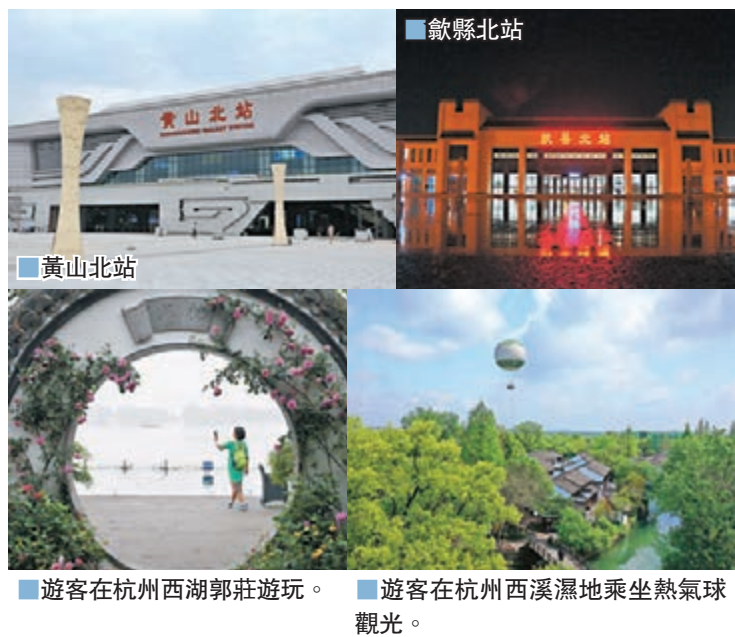
■歙縣北站 ■黃山北站 ■遊客在杭州西湖郭莊遊玩。 ■遊客在杭州西溪濕地乘坐熱氣球觀光。

早前，黃山北站到發旅客3.1萬人次，創下今年以來單日客流最高紀錄，熱鬧的黃山北站見證了杭黃高鐵與合福高鐵這兩條以「高顏值」著稱的高鐵線再次釋放活力。