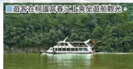
遊客在桐廬富春江上乘坐遊船觀光。