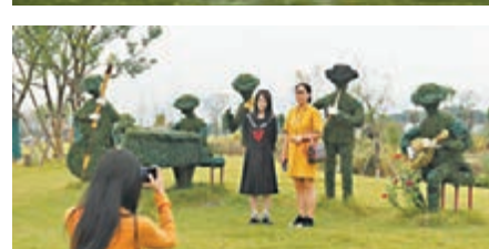
遊客在桐廬荻浦村的花海參觀。