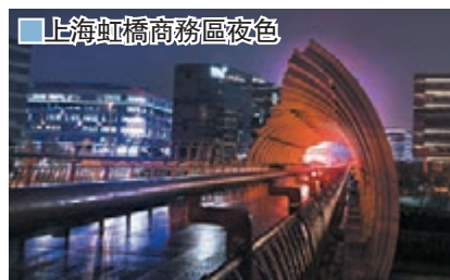
上海虹橋商務區夜色