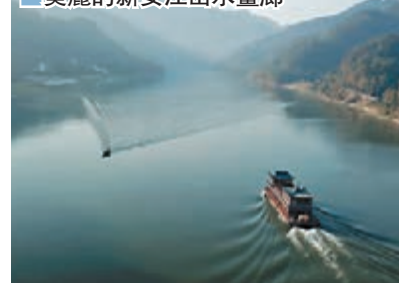
美麗的新安江山水畫廊