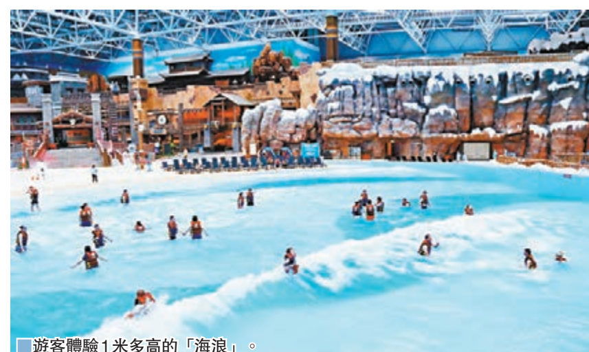
遊客體驗1米多高的「海浪」。

「水世界」總建築面積3.5萬平方米，全年室內溫度28℃以上，水溫恆定保持在33℃，以藏羌冰雪為主題設計了冰山區、羌寨區、SPA雪山區、SPA園林區四大主題區，遊客可以體驗大喇叭、大浪板等多台大型玩水設備，享受各種溫泉池泡、足溪、石板浴、巖盤浴、雪屋、鹽磚房、干蒸、濕蒸等共計