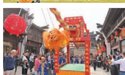
遊客在浙江建德嚴州古城觀看民俗表演。