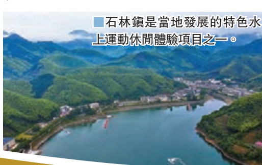
石林鎮是當地發展的特色水上運動休閒體驗項目之一。

目前石林鎮已經成立6家運動俱樂部，建成運營20餘個運動項目和30餘家酒店、民宿。運動休閒旅遊產業的發展加快了當地鄉村振興的步伐，2020年4月份石林鎮旅遊接待約50,000人次。