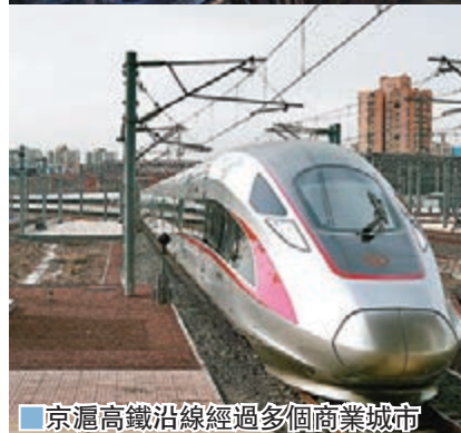
京滬高鐵沿線經過多個商業城市

從上海到北京，1,300多公里的距離，京滬高鐵最快只要4小時18分鐘到達。從長三角到京津冀，一路好風景，處處見嬗變……讓我們跟隨飛馳的列車，一起領略精華版的中國經濟「風景線」。作為中國鐵路網絡「熱點」，上海虹橋火車站與多個高鐵骨幹網連接，如京滬、滬寧、滬杭、滬昆、徐蘭高鐵等。