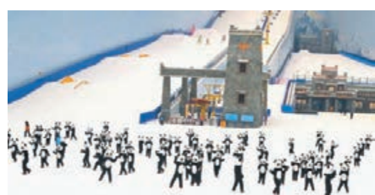
大熊貓玩偶成宣傳大使

而京滬高鐵五大樞紐車站之一的南京南站，平時日均發送旅客量約10萬人次，在這個樞紐站，下了地鐵上高鐵，換乘全程最多不過8分鐘。以南京南站為中心，高鐵4小時內可達北京、上海、杭州，這個壓縮時空的旅遊所——國家會展中心、為城市發展帶來了活力，沿途欣賞多個城市都市商業化及現代化的美景。