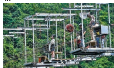
遊客在石林鎮的千島湖石林景區內體驗「懸崖大秋千」。