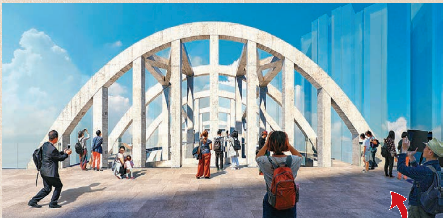
皇都戲院的天台桁架是其標記，曾獲國際保育組織稱為全球獨一無二的建築設計。新世界團隊將力保整個皇都戲院建築及天台桁架。左為效果圖。

新世界發展執行副主席兼行政總裁鄭志剛表示，集團剛就北角皇都戲院大廈完成強拍和統一業權，需要時間讓保育團隊勘探及制定保育計劃，暫未能提供項目整體投資額和保育成本，但希望將項目打造成聯合國教科文組織認可的國際古蹟。