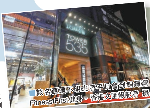
該名源頭不明患者平日會到銅鑼灣Fitness First健身。