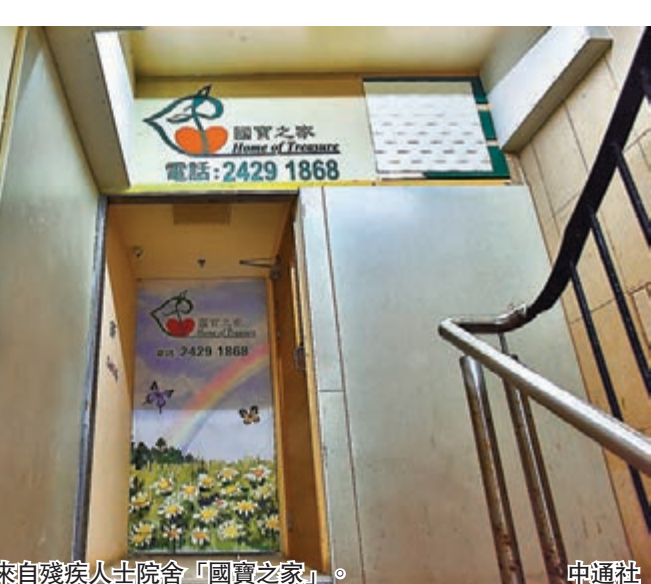
其中11宗確診個案來自殘疾人士院舍「國寶之家」。

示，該名保險代理人正接受治療，最後上班日是本周一（5日），而宏利已關閉其涉及的辦公室樓層，昨日進行徹底清潔和消毒。宏利原訂今日在宏利金鐘中心舉辦的一場大型專業講座，初步確診的代理人及其團隊已取消參加所有大型會議及活動。