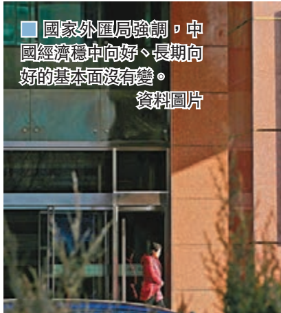
國家外匯局強調，中國經濟穩中向好、長期向好的基本面沒有變。資料圖片

較8月末減少220.47億美元，結束此前連續5月上漲勢頭。專家表示，非美元貨幣集體貶值、歐美股市普跌以及跨境資本流出增多，是導致外匯儲備規模下降的主要原因。國家外匯管理局副局長、新聞發言人王春英分析外匯儲備下降的原因稱，上月國際金融市場上，受境外新冠肺炎疫情反覆、主要國家貨幣和財政政策等因素影響，美元指數小幅上漲，資產價格漲跌互現。匯率折算和資產價格變化等因素綜合作用，當月外匯儲備規模有所下降。