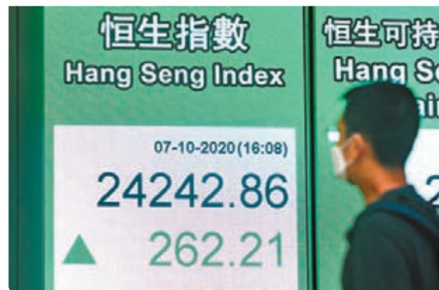
港股連升4日，昨成交升至925億元。

其他股份方面，半新股明源雲(0909)再破頂，全日再升6.3%報35.5元，相對其招股價16.5元，已累升1.15倍。不過，被指受惠疫情的港視(1137)，9月份交易額按月跌近11%，令該股昨日要跌4.4%。高鑫(6808)挫11.2%報7.73元，主要因瑞銀降其評級及目標價，由15.62元大削42%至9.07元。